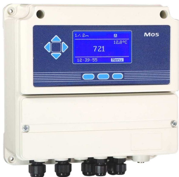
M05-CD - IP65-kapsling